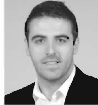
por FILIPE DE OLIVEIRA

estrela em competições oficiais. O evento designado por "Torneio 25 de Abril" foi organizado pelo Sport Clube Maria da Fonte e decorreu na Póvoa de Lanhoso.